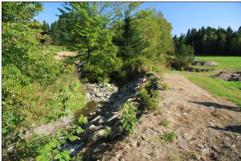
Trois perrés aménagés par le MAPAQ