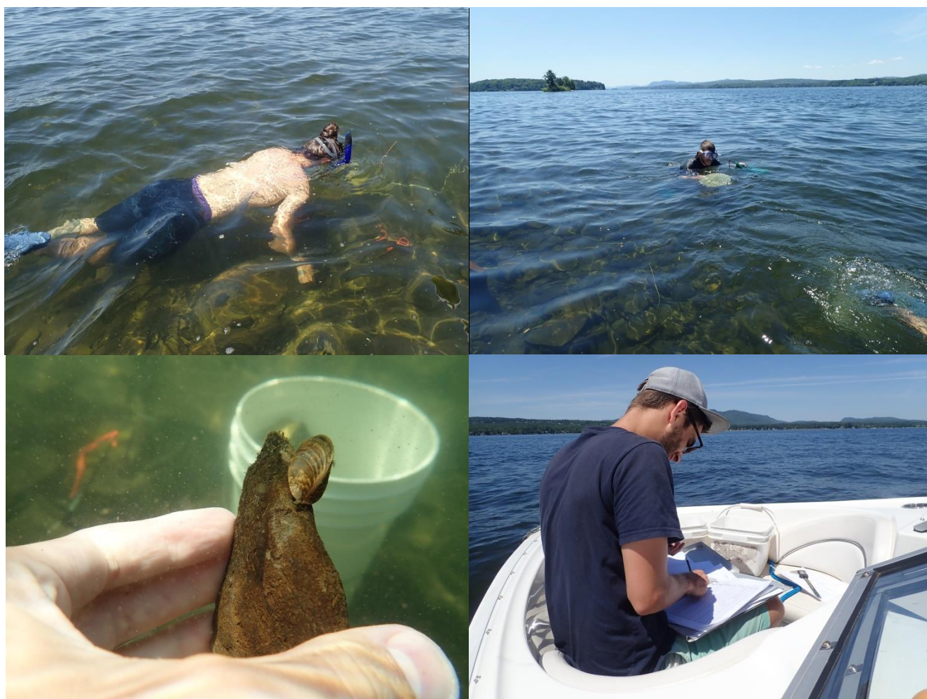
Figure 2. Inventaire des moules zébrées le 20 juillet 2018. A (en haut à gauche) : Inventaire par apnée des zones peu profondes. B (en haut à droite) : inventaire par apnée des zones plus profondes et examen des roches en surface. C (en bas à gauche) : Inspection des roches pour détecter la présence de moules zébrées. D (en bas à droite) : prise de mesures et de notes sur des fiches standardisées.

future et sont disponibles sur demande. La longueur des coquilles était ensuite mesurée au 0,5 mm près à l'aide d'un vernier et comptabilisée, sauf pour la station inventoriée le 21 juillet. Le calcul de la densité a ensuite été effectué à l'aide du nombre de moules zébrées trouvées dans chaque station dans les 10 m 2 total de quadrats inventoriés. La longueur moyenne et l'écart-type ont été mesurés à l'aide de l'ensemble des coquilles vivantes répertoriées dans les quadrats pour chaque station. Bien que notées, les coquilles vides n'ont pas été considérées dans le calcul de la densité ou de la moyenne de longueur. Les données étaient notées sur des fiches standardisées pour les inventaires quantitatifs par quadrats. Les quadrats ont été sélectionnés à l'aide de la fonction de sélection aléatoire de nombre du logiciel EXCEL. La cartographie a été effectuée à l'aide du logiciel QGIS et les analyses à l'aide du logiciel Excel. L'histogramme a été effectué à l'aide du logiciel SPSS 21.