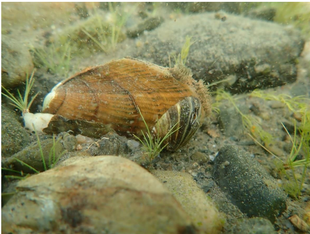
Figure 4. Moule zébrée ( Dreissena polymorpha ) colonisant une lampsile rayée ( Lampsilis radiata ) au lac Memphrémagog le 20 juillet 2018.