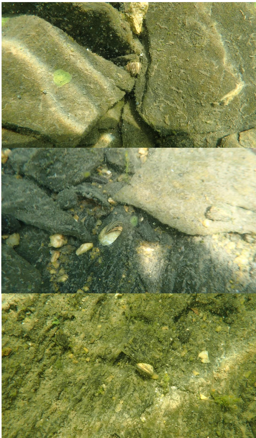
Figure 3. Moules zébrées observées à la surface des roches