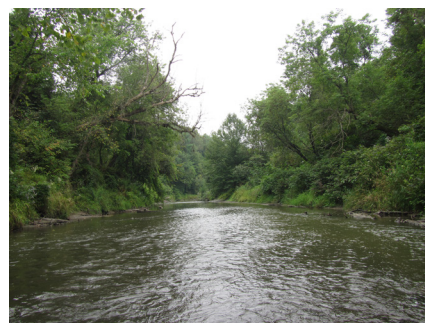
Rivière Yamachiche, 2013