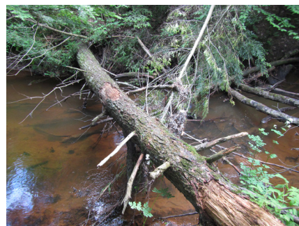
Ruisseau Saint-Charles, 2014