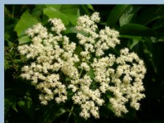
Sureau du Canada