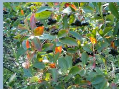
Aronie à fruits noirs