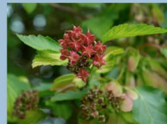
Physocarbe à feuilles d'obier