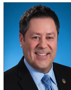
Pierre Michel Auger Député de Champlain

Bureau de circonscription 278, rue Saint-Laurent, Trois-Rivières (Québec) G8T 6G7 Tél. : 819 694-4600 | Téléc. : 819 694-4606 pierre-michel.auger.chmp@assnat.qc.ca