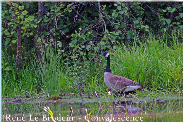
René Le Brodeur - Convalescence