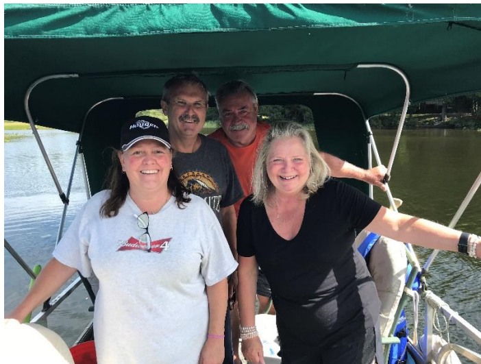
Journée sur le terrain pour la caractérisation des herbiers aquatiques au lac au Loup, été 2019

Mont-Tremblant, 4 février 2021 – L'Organisme de bassins versants des rivières Rouge, Petite Nation et Saumon (OBV RPNS) est fier d'annoncer que le plan directeur du bassin versant du lac au Loup, à Boileau, est maintenant complété et disponible en ligne . C'est grâce au soutien financier de la MRC de Papineau et de la municipalité de Boileau ainsi que de l'implication de l'Association des propriétaires du lac au Loup (APLL) que le projet a pu voir le jour.