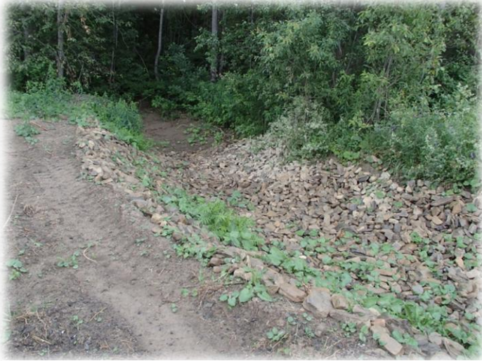
Fossé aménagé en 2013 à St-Léon-Le-Grand