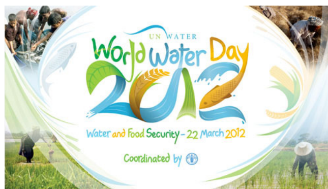
Exemple d'une affiche de campagne Extrait du site des Nations Unies

Cette croissance démographique se traduira par une augmentation considérable de la demande des ressources et particulièrement de l'eau. En dépit du fait que 70 % de la planète soit recouverte d'eau, seulement 2.5 % de celle-ci est de l'eau douce. Au regard de notre gestion actuelle et du fait qu'aujourd'hui des milliers de personnes à travers le monde n'ont toujours pas accès à de l'eau potable, il y a nécessité de changer nos habitudes et méthodes de gestion afin de pouvoir garantir à tous et aux générations futures un accès adéquat à cette ressource.