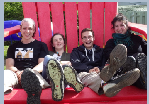
Escouade de lac 2016