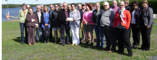
Rencontre annuelle des associations de riverains

Le 11 septembre dernier a eu lieu la rencontre annuelle des associations de riverains du bassin versant de la rivière Chaudière. Cette année, la rencontre s'est tenue dans une municipalité du territoire et c'est l'Association pour la protection du lac Drolet (APDLD) qui nous a chaleureusement accueillis. Une dizaine d'associations de riverains du territoire étaient représentées. Au programme, la présentation et la visite des aménagements du terrain de l'Organisation des Terrains de Jeux (O.T.J.) de la municipalité de Lac-Drolet où l'APDLD a aménagé une bande riveraine modèle dans le cadre de son projet J'ai pour toi un lac . Ce rendez-vous fût encore une fois grandement apprécié par la vingtaine de participants présents qui y ont vu un moment propice pour échanger sur leurs expériences.