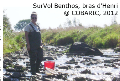
SurVol Benthos, bras d'Henri

Le COBARIC a procédé à l'échantillonnage des insectes benthiques dans le bras d'Henri à Saint-Narcisse. Les insectes aquatiques, les crustacés, les vers et les mollusques sont des macroinvertébrés benthiques largement utilisés pour évaluer la santé des lacs et des cours d'eau. Les espèces présentes et leur abondance sont un bon indicateur de la santé d'un écosystème. Les résultats de l'échantillonnage seront disponibles au printemps 2013.