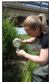
Échantillonnage des pesticides, bras d'Henri

La phase pilote du projet, en cours jusqu'au 31 mars 2013, servira à mieux caractériser le territoire pour identifier les problématiques et les zones prioritaires. Ceci facilitera la mise en place d'actions concrètes dès le démarrage du projet collectif en avril prochain. En plus d'avoir échantillonné le benthos, le COBARIC a procédé à l'échantillonnage des pesticides dans deux stations d'échantillonnage du bassin versant, et en collaboration avec le MAPAQ, les zones à risques élevées de perte de sol ont été évaluées sur l'ensemble du bassin versant via des outils géomatiques.