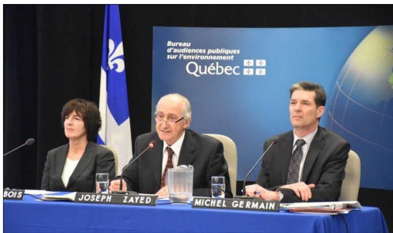
BAPE dans le cadre de la consultation publique entourant le projet d'oléoduc Énergie Est (TC Media, 2016)

Le COBARIC a déposé un mémoire contenant quatorze recommandations au Bureau d'audience publique sur l'environnement (BAPE) dans le cadre de la consultation publique entourant le projet d'oléoduc Énergie Est.