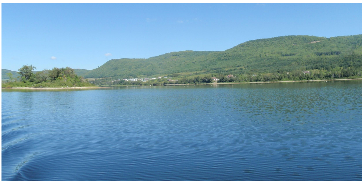
Lac au saumon.