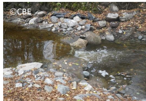
Seuil 1 en amont et seuil 2 en aval de la rivière le Bras.

En effet, les seuils ont pour but de créer une diversification du cours d'eau et des bassins permettant le repos de l'omble de Fontaine tout en lui offrant des sites de reproduction adéquats. Ces seuils aménagés s'inscrivent dans la continuité des efforts déployés par le Comité de mise en valeur de la rivière Le Bras (CMVRLB) et le CBE dans la dernière décennie.