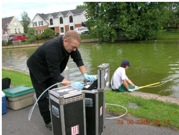
Photo 1 – Échantillonnage à la station en amont de Granby le 29 août 2006. La mesure des BPC, des dioxines et furanes chlorés, des HAP et de certains autres contaminants requiert le remplissage de 3 contenants de 18 litres en acier inoxydable. L'échantillon est prélevé à l'aide d'une pompe et d'un boyau qui permettent d'acheminer l'eau directement dans les contenants, lesquels sont placés dans des caissons de protection. Lors de cette tournée d'échantillonnage, l'exutoire du lac Boivin était envahi par des cyanobactéries.