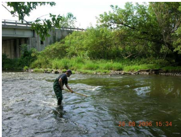
Photo 2 – Échantillonnage à la station en aval de Granby le 29 août 2006. Certains contaminants peuvent être analysés dans de plus petits volumes d'eau. L'échantillonnage se fait alors à l'aide d'une bouteille fixée à l'extrémité d'une perche.