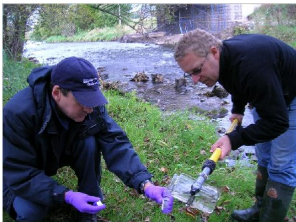
Photo 3 – Échantillonnage à la station en aval de Granby le 26 septembre 2006. Transvasement d'eau vers une petite bouteille prévue pour l'analyse des composés organiques volatils.

À la station d'échantillonnage située en aval de Granby, dont les résultats sont synthétisés dans la dernière colonne du tableau, on ne constate que des diminutions de concentrations ou presque (valeurs négatives). Les diminutions de concentrations sont substantielles et