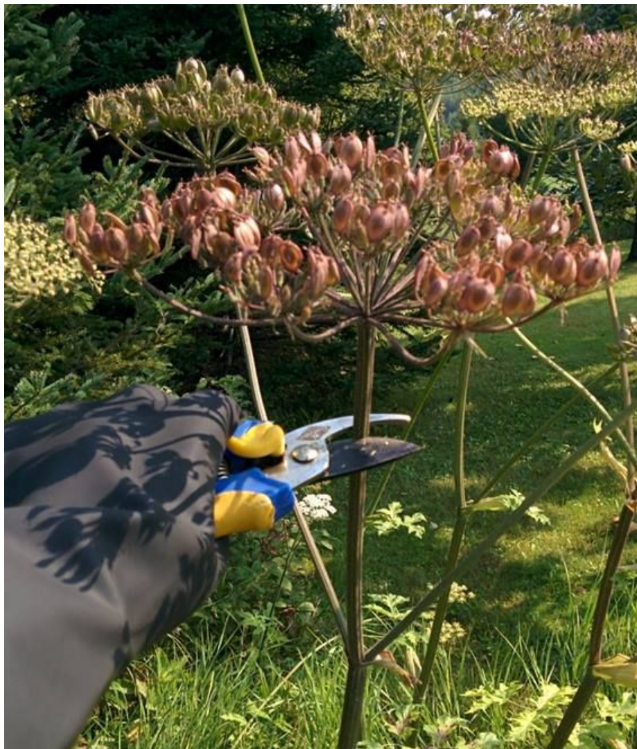
Coupe d'ombelles.

OBVMR organisme de bassin versant MATAPÉDIA-RESTIGOUCHE watershed organization