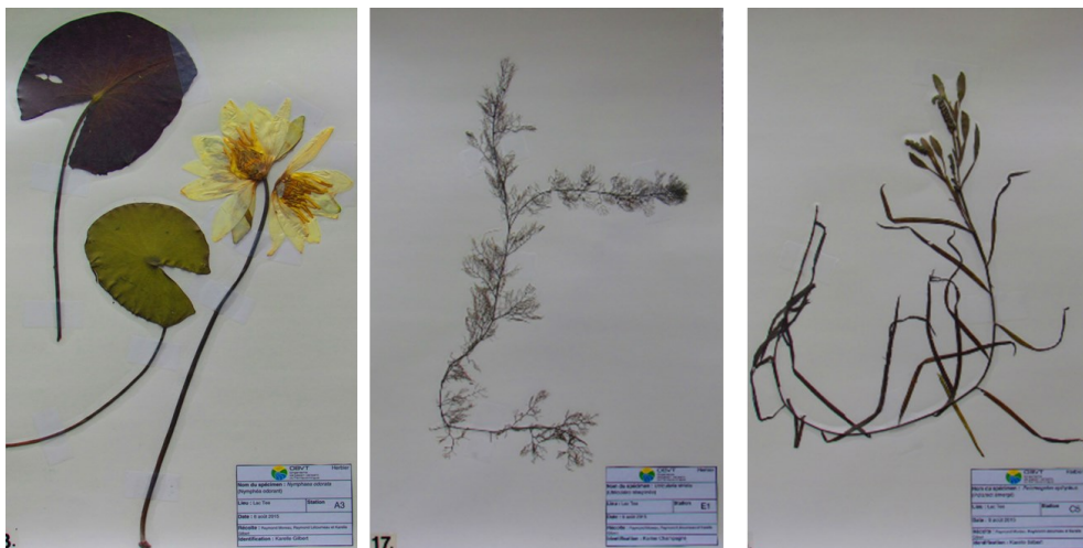
Exemple de planches réalisées par l'Association du lac Tee

Quatre associations de riverains du Témiscamingue ont répondu à l'appel de l'OBVT pour réaliser des herbiers aquatiques de leur plan d'eau. Une très belle réussite : les riverains ont une meilleure connaissance de leur lacs et sont mieux outillés pour détecter l'arrivée de nouvelles espèces, notamment les espèces exotiques envahissantes.