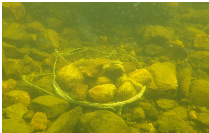
Collecteur d'œufs de touladi

L'OBVT a eu le plaisir de joindre ses efforts à ceux du ministère pour mieux connaître la reproduction de ce poisson. Des collecteurs d'œufs ont été disposés sur des frayères bien connues pour savoir comment elles sont utilisées : profondeur à laquelle les œufs sont déposés, substrat préféré, etc. Le but est de trouver d'autres mesures à mettre en place pour leur venir en aide.