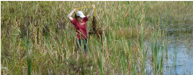
Inventaire de plantes aquatiques envahissantes

Cependant, 6 stations de salicaires pourpres ont été découvertes, à chaque fois dans les fossés le long des routes. Ces observations ont été rapportées sur le site internet Sentinelle . Ce site a été créé pour récolter les informations du public, alors vous aussi n'hésitez pas à mentionner des observations ! (photographies requises).