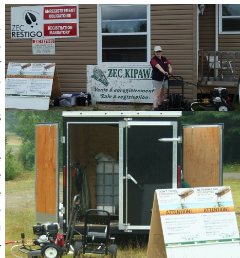
Lavage de bateaux 2015

Ce projet d'envergure de l'OBVT a vu le jour cet été grâce à une mobilisation remarquable de ses partenaires : municipalités de Témiscaming et de Kipawa, parc national d'Opémican, communauté Algonquine de Wolf Lake First Nation, association des riverains du lac Tee (Témiscaming). L'implication financière de la Fondation de la faune du Québec, de l'assemblée nationale (député provinciale Abitibi-Témiscamingue) et de l'association des pourvoires a également été déterminant.