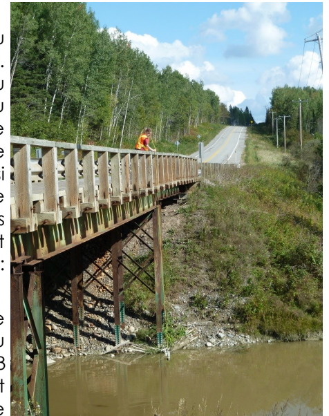
Échantillonnage sur le terrain

Les résultats seront analysés en détail au cours de l'automne et de l'hiver et seront bien évidemment disponibles sur notre site internet et dans le prochain bulletin !