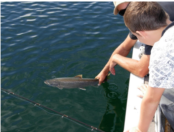
Un géniteur remis à l'eau, des milliers d'alevins sauvés !

De plus en plus de pêcheurs sportifs effectuent la remise à l'eau de leur capture, mais l'efficacité de cette pratique repose sur la présomption que le poisson gracié va survivre pour grandir et se reproduire. En effet, certaines techniques ou engins permis peuvent avoir un impact important sur la survie des poissons relâchés. Mais lesquels sont à prioriser afin de maximiser le taux de survie lors de la remise à l'eau ?