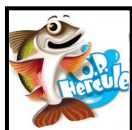
Op-Hercule © 2012, Johanne Morin, École l'Étincelle de Ste- Marguerite