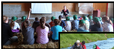
Journée éducative sur l'agriculture et l'environnement

Des enfants de l'école l'Arc-en-ciel de St-Narcisse ont participé, le 5 juin 2012, à la journée organisée par le COBARIC en collaboration avec les Ministères de l'Agriculture, des Pêcheries et de l'Alimentation (MAPAQ) et des Ressources naturelles et de la Faune (MRNF) chez un producteur laitier. Cette journée a été une opportunité de sensibiliser les jeunes à la vie aquatique, par la tenue d'une activité de pêche électrique dans la rivière du