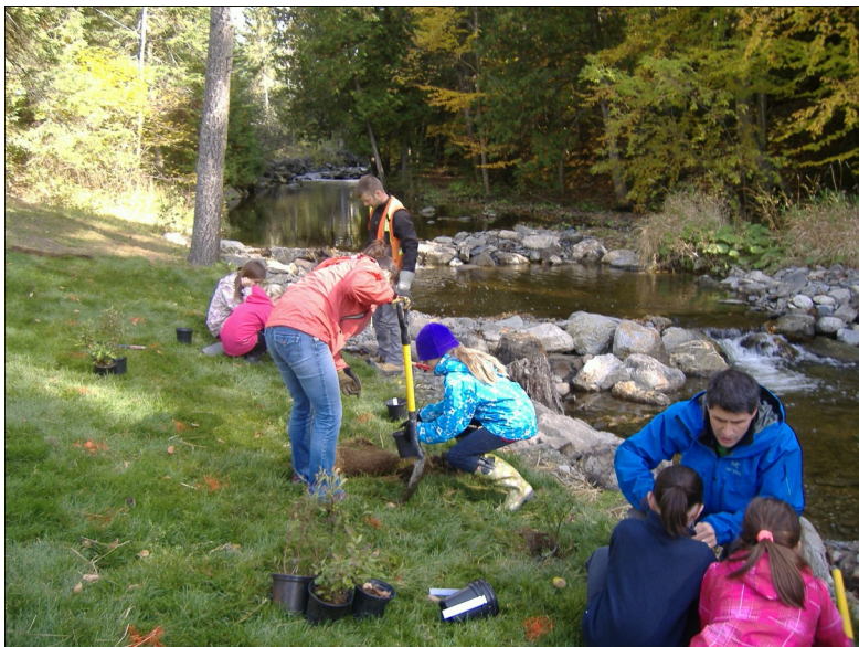
Plantation de végétaux au parc Rodrigue à Saint-Georges