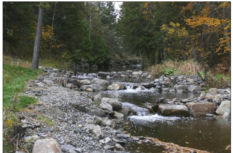
Ruisseau d'Ardoise au parc Rodrigue à Saint-Georges (COBARIC, 2015)

Le projet d'amélioration et de restauration de l'habitat de l'omble de fontaine dans le ruisseau d'Ardoise à Saint-Georges s'est conclu le 16 octobre dernier. Initié par le COBARIC et piloté par Gestizone, ce projet estimé à 168 600$ a permis d'aménager, entre autres, quatre seuils et autant de fosses, de même que trois frayères.